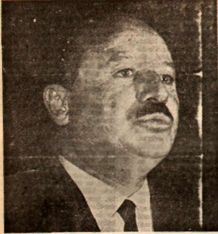
İçişleri Bakanı Faruk Sükan Ne şis, ne kebap...