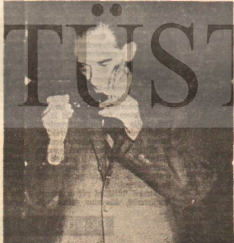
Sağlık Bakanı Edip Somunoğlu «Ah şu bunlar teşvikçiler...»

Kolera epidemisi, İranda Ku histan vâdisinde yayılıp Güneye doğru inerken, diğer taraf tan 1965'in bahar aylarında Tahran ve çevresine ulaşmıştır. Yaz aylarında Kuzeye çıkmış,