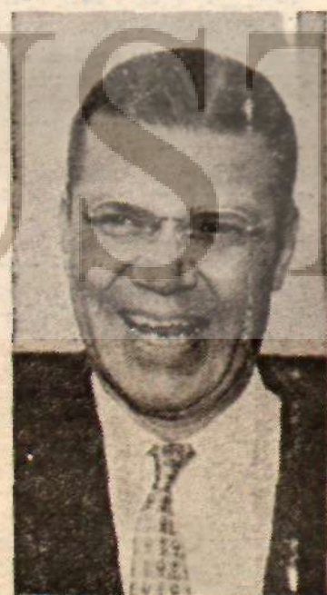
Me Namara Ne İsteyecek?

Savunma Bakanları arasındaki temasların, kanımızca asıl en- dişe edilecek tarafı, özellikle nükleer alanda Amerikaya sağ- lanacak yeni imkânlarla Sovyet- lerin tahrik edilmesi ve İnönü Hükümeti sırasında başlayan yakınlaşmanın sabote edilmesi- dir. Yeni Hükümet, Kossigin'in davetini geciktirmiştir. Çağlayan- ın soruları «çağıracağız» deyip geçiştirmekte, fakat bir türlü ziyareti günü tesbit edilmemek-