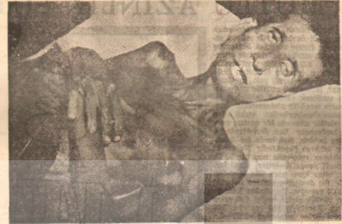
Kolera'ya tutulmuş bir hasta

İnce politikacı hesabı ile, hac tan vazgeçmeyi bir türlü göze alamayan İktidar, durumu kur tarmak için, tabii ki nazıya göre şerbet verici bilgiler topladılar: Arap ülkeleri ve İran kolera ol